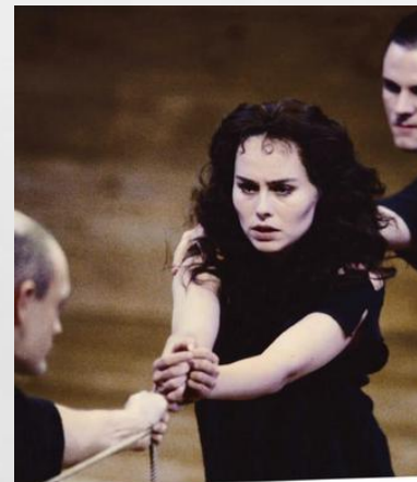
Jean Anouilh Antigone